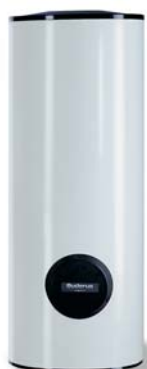
Бак-водонагреватель Logalux SU400

Не важно, ищите ли вы компактный тепловой насос, позволяющий сэкономить место, или мощное устройство, позволяющее обеспечить теплом многоквартирный дом – все это вы найдете в Buderus. Новые рассольно-водяные тепловые насосы Logatherm WPS позволяют иметь практически неиссякаемое тепло, источником которого является сама природа.