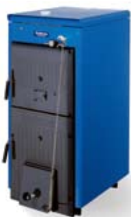
Logano G211 D

Коррозионно-стойкий отопительный котел Logano G211 D представляет собой отличное решение. Он может быть подключен без использования сварки к существующей отопительной системе и характеризуется простотой монтажа. Доступные и удобные в эксплуатации камера сгорания и топливный бункер. Чугунный отопительный котел Logano G211 D не только выглядит прочным и надежным, но на самом деле гарантирует то, что обещает: комфортное тепло много зим подряд.